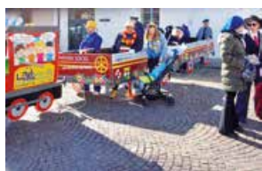
Nelle immagini, il Trenino di Carnevale, una delle iniziative dell'associazione culturale LocoMotiva Aps

Per chi vuole staccare davvero, in programma una gita di 5-7 giorni: stiamo scegliendo tra il relax di Ischia o il fascino di una crociera nel Mediterraneo